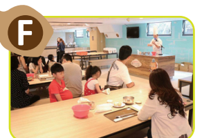
F 創意烘焙教室 完善專業的手作體驗場域，規劃獨立洗手區與寬敞的體驗區。