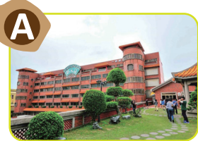
A 優良觀光工廠 氣勢雄偉蘊含古風的宮廷式特色建築為郭元益的生產中心。