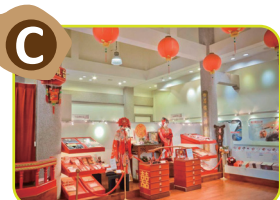
C 糕餅文化館 徜徉餅食文化天地，讓歷史風俗代代傳承出新。