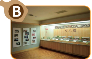
B 古六禮俗區 藉由模型展示，一窺古代六大嫁娶儀式流程。