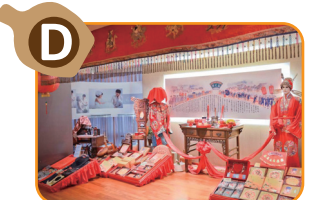
D 婚嫁禮俗區 結合各式婚禮備品與招親台場景，彷彿親臨傳統婚禮的禮制。