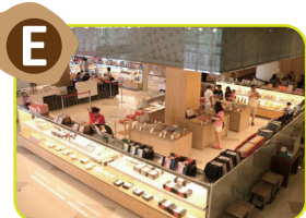
E 嚴選伴手禮區 明亮潔淨的空間，提供遊客各式精美伴手禮。