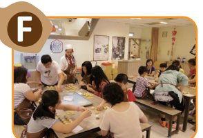
F 創意烘焙教室 獨立的手作空間，提供多元化的糕餅DIY活動。