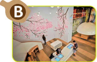
B 綠標展覽館 結合綠色互動設施，帶您一窺黃金級綠建築的各項設計特色。